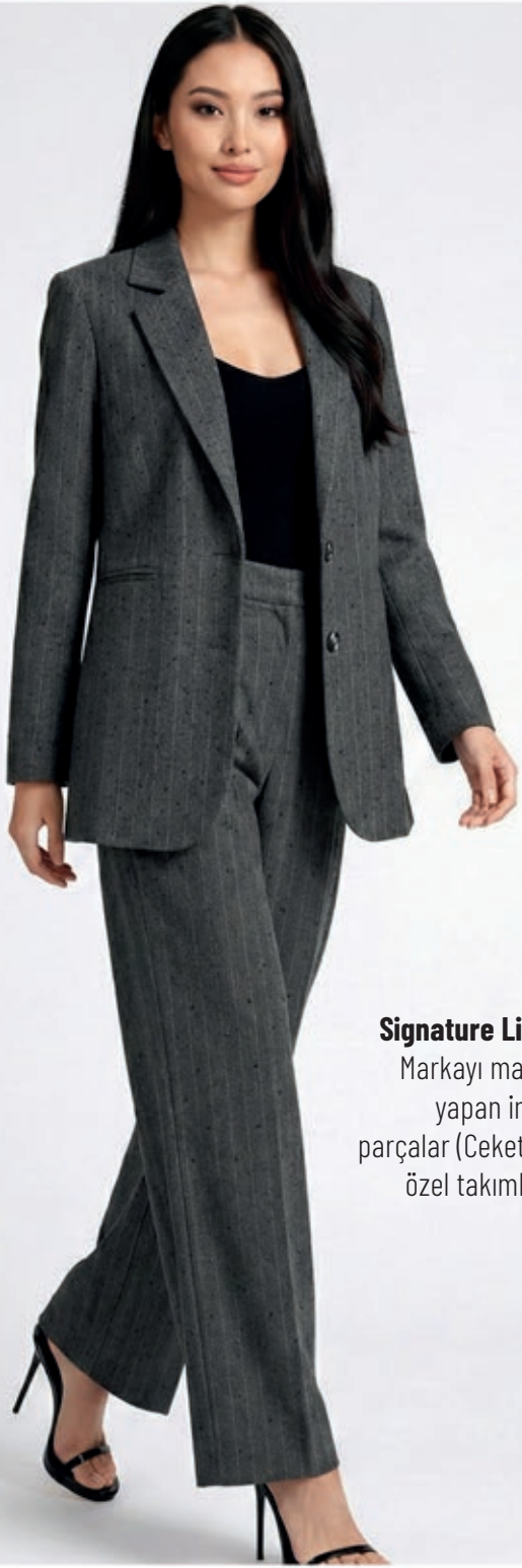
Signature Line: Markayı marka yapan imza parçalar (Ceketler, özel takımlar).