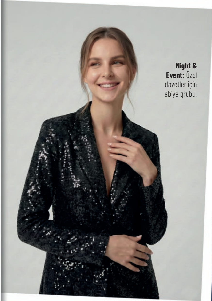
Night & Event: Özel davetler için abiye grubu.